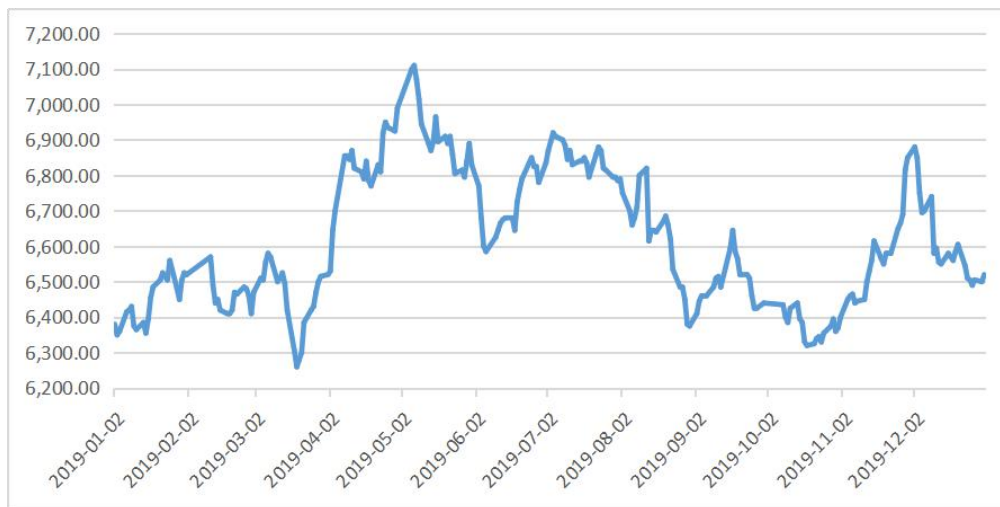
图 2 2019 年 PVC 期货结算价（活跃合约）走势图